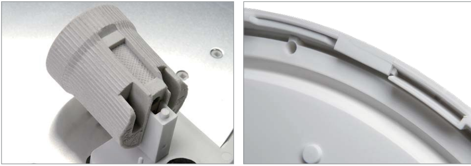
Detale / efekt | Details / effect