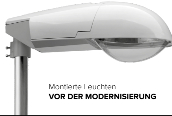
Montierte Leuchten VOR DER MODERNISIERUNG

Der Austausch der Straßenleuchten, von Natriumdampflampen zu modernen LED-Lampen mit Steuerung , ist nicht nur eine Frage von Ästhetik, Ökologie und Komfort, sondern vor allem auch der Ersparnis . Dank dieser Investition wird die Stadt jährlich mehr als 50 % weniger Strom verbrauchen, und fast 8400 EUR jährlich sparen. Über einen Zeitraum von 30 Jahren (so viel beträgt die Lebensdauer der neuen Beleuchtung), bringt die Investition Ersparnisse auf einem Niveau von mehr als 252 222 EUR .