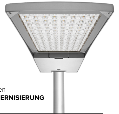
Montierte Leuchten NACH DER MODERNISIERUNG

168 W sodium vapour lamp – 161 pieces 279 W sodium vapour lamp – 13 pieces