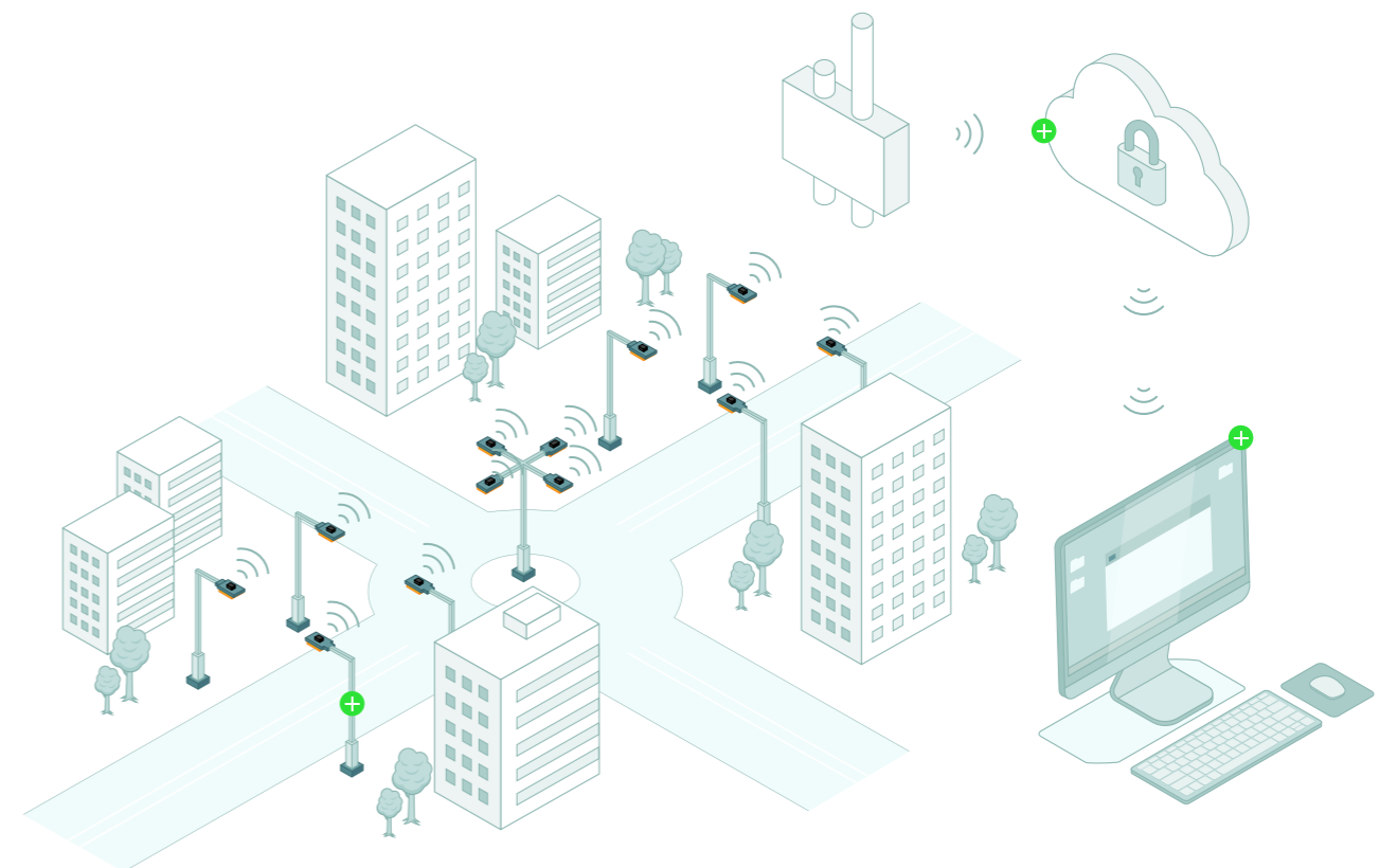
Funktionsschema des CLUE CITY Systems. Zwei-Wege-Kommunikation und Beleuchtungsverwaltung