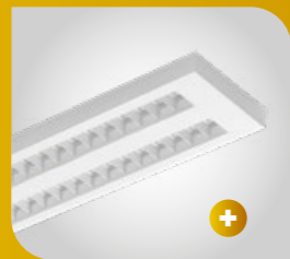
Lampa w wersji podwójnej (62W, 72W)