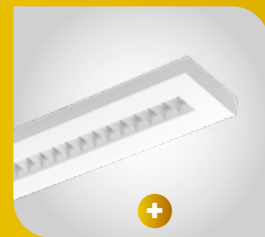
Lampa w wersji pojedynczej (31W, 36W, 48W)