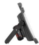
Magnum M MultiBattery 4050 lm