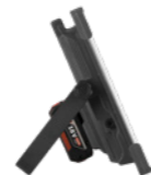
Magnum L MultiBattery 9250 lm